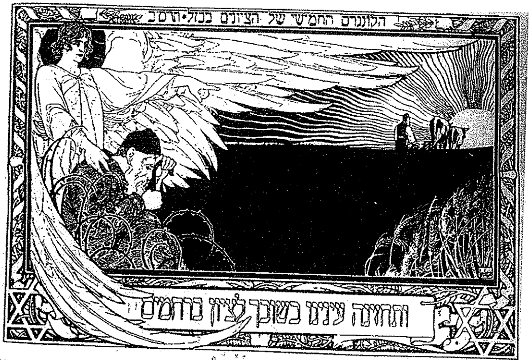
(איור מאת משה ליליין, מהגטו לציון, מתוך הארכיון של בצלאל.)