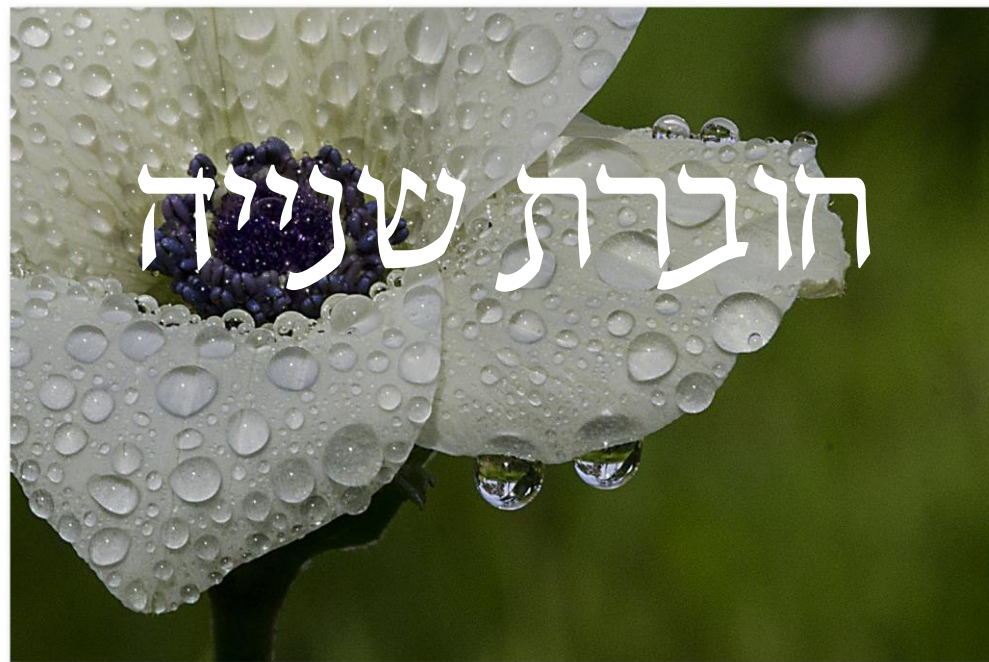
Yosi Ishlach - Photographer